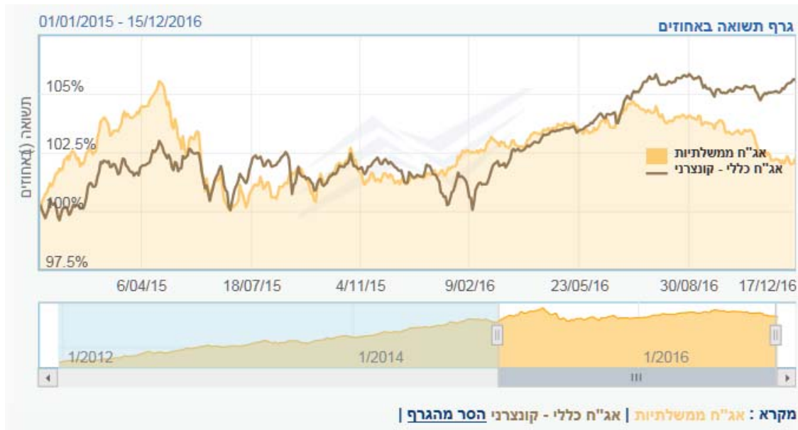
גרף 6 - מדדי אג"ח ממשלתי ואג"ח חברות 2015-2016