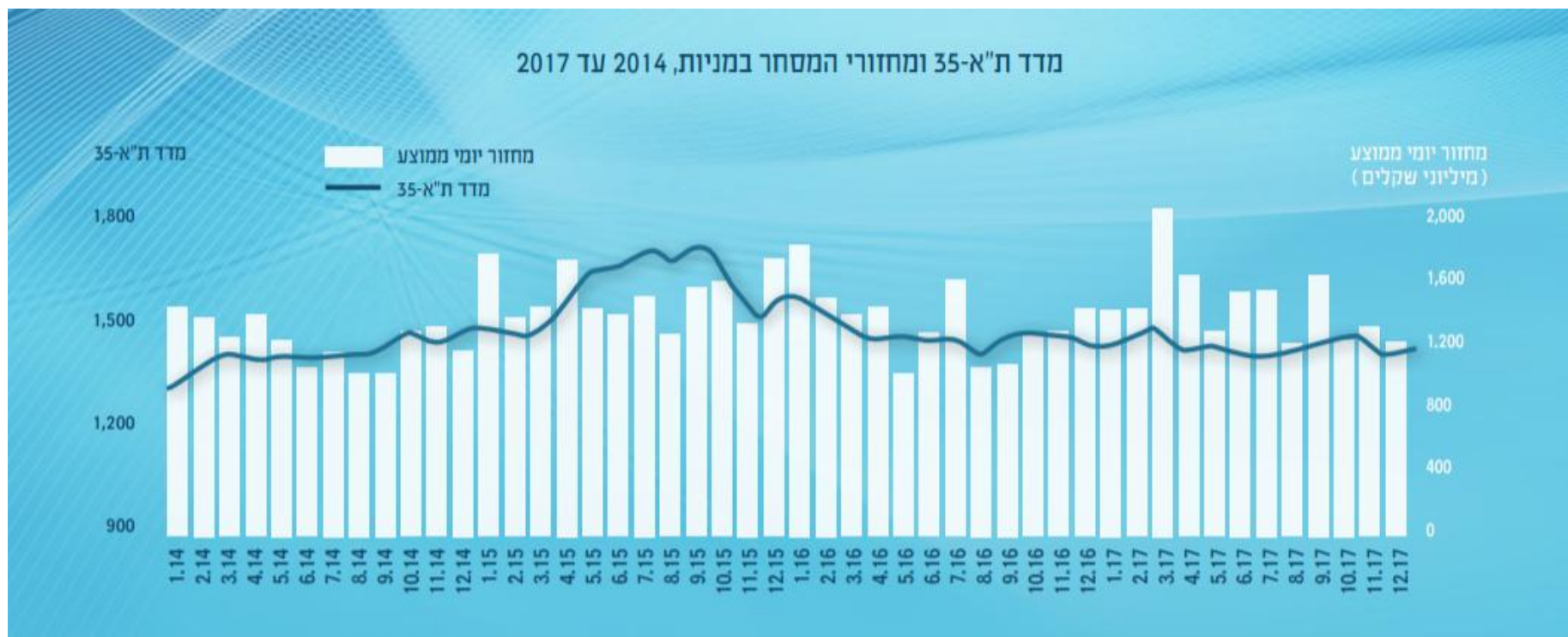
גרף 1 - מדד ת"א-35 ומחזורי המסחר במניות, 2014 עד 2017