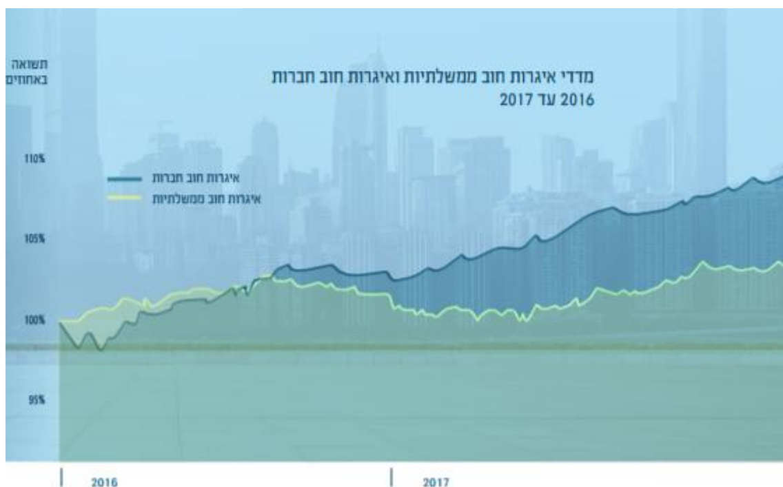
גרף 6 - מדדי אג"ח ממשלתי ואג"ח חברות 2017-2016